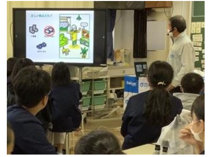
避難時の服装はどれ？