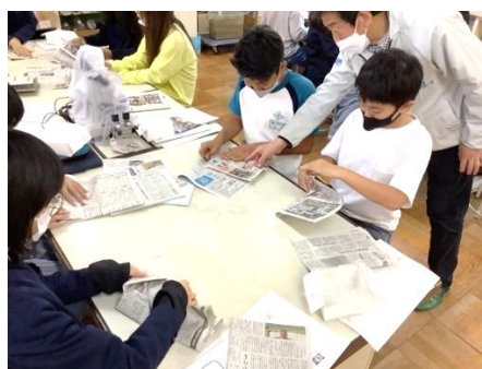
新聞紙でスリッパをつくろう！