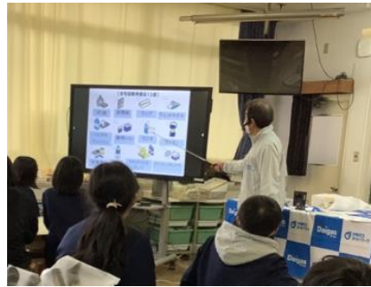
自宅難準備品 12 選暗記クイズ