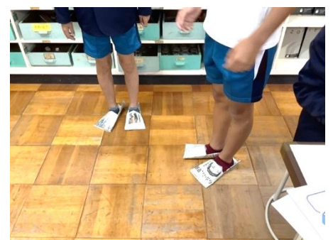
新聞スリッパで歩いてみよう