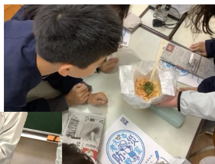
水筒でパスタができるよ！