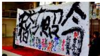
〈書道パフォーマンス〉